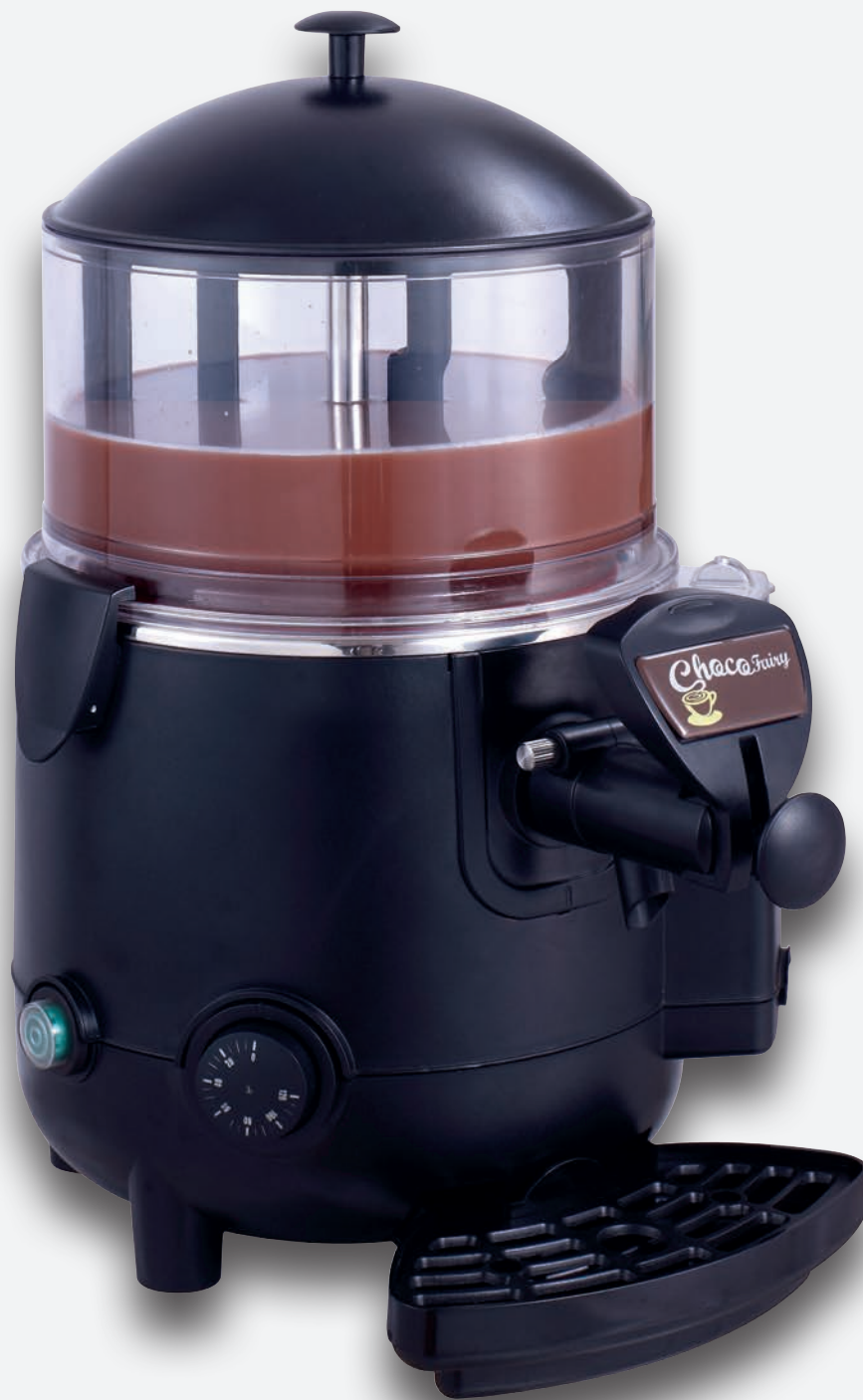
Mod. CHOCO 5