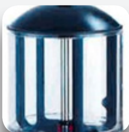
Depósito 10L gran visibilidad.